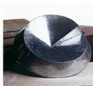
◀ Coupe en tôle galvanisée, Ø 32 cm, 1997 (collection Paris-Tananarive)