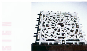
◀ Dessous de plat trapézoïdal, aluminium, 22 x 20 cm, 1997 (collection Evans et Wong).