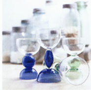
► «Verres d'artistes, verres à boire», créés (1996) pour la galerie Suzel Berna.