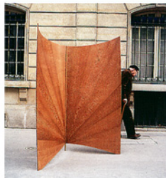
◀ Paravent «Oya», bois de louro faya et carbone, H. 200 cm (charnières navales Leclerc, Saint-Malo).