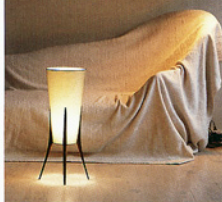
▲ Lampe en soie brute et palissandre, H. 60 cm, créée (1997) pour «La Case d'Ylang».