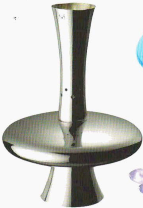
Space, lampe Berger réalisée par Sabatini en métal argenté.