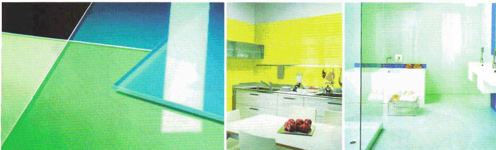
Carrelages muraux en verre de la collection Feelings éditée par Saint-Gobain Glass en collaboration avec l'architecte Patrick Nadeau.

petit bibendum en métal argenté et résine polyester, dont la tête est une cuillère, le torse un rond de serviette et le reste du corps une timbale. Le tout pour un prix raisonnable. En 2006, JBSB continue ce travail très réfléchi. Chez l'italien Valli & Valli, il dessine une collection de poignées de portes. On est dans le micro-produit qui s'avère capital le jour où l'on cherche quelque chose de différent qu'on ne changera pas de sitôt.