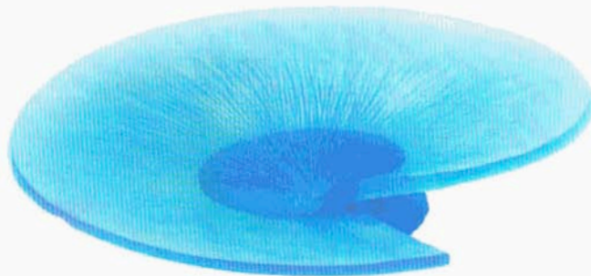
Coupe en pâte de cristal Rototondo (Daum, 2004) réalisée en 125 exemplaires.