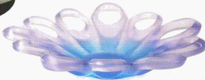
Coupe Cosmos (2005, Daum) en pâte de verre.