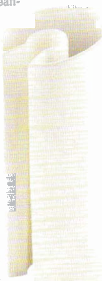
Carafe Cool (Ligne Roset, 2004).