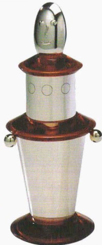
L'ensemble timbale-rond de serviette-cuillère Polichinelle (1995), un cadeau de naissance original réalisé pour Puiforcat.

deux pas, il nous avait présenté la maison Daum dont il est directeur artistique depuis 1999. Il insiste sur l'éclectisme des choix de cette maison. Aux côtés des artistes qui réalisent des pièces en édition limitée, Jean-Baptiste a invité douze de ses pairs à faire de même, d'Enzo Mari à Stefano Poleri. Il maintient ainsi Daum captif de la modernité sans fêler ni son image, ni son savoir-faire. Elaborer un modèle peut tenir du défi. Le verre lui-même peut s'avérer rebelle. Daum n'attendait pas le designer comme une star garante de succès : il crée et initie vases et sculptures pour des collectionneurs ou des amateurs qui n'achètent ni sur un nom de designer ni sur une impulsion. En janvier, Jean-Baptiste a présenté au salon Maison & Objet sa Fleur envolée , une vraie sculpture modélisée sur ordinateur, une première chez Daum. Editée à 275 exemplaires dans la collection Daum